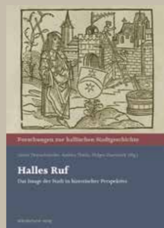
Bd. 26: Halles Ruf Das Image der Stadt in historischer Perspektive Gerrit Deutschländer/Andrea Thiele/Holger Zaunstock (Hg.) 320 S., 28,00 EUR