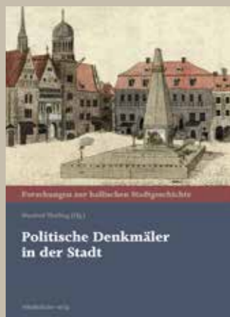
Bd. 23: Politische Denkmäler in der Stadt MANFRED HETTLING (Hg.) 240 S., EUR 24,00