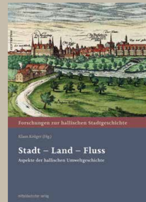
Bd. 29: Stadt – Land – Fluss Aspekte der hallischen Umweltgeschichte Klaus Krüger (Hg.) 244 S., EUR 30,00