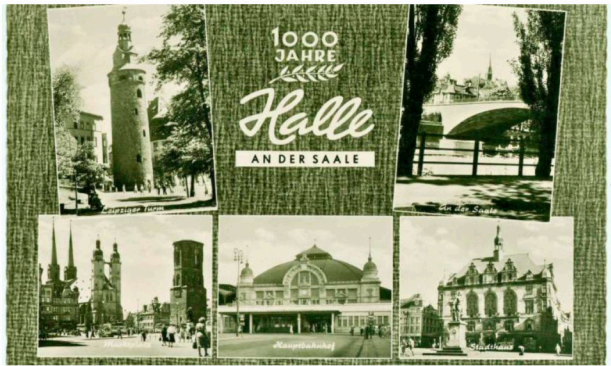
Auch in der DDR bemühte sich Halle um einen guten Ruf. Zum Beispiel mit Postkarten, die 1961 anlässlich der 1.000-Jahr-Feier verbreitet wurden.