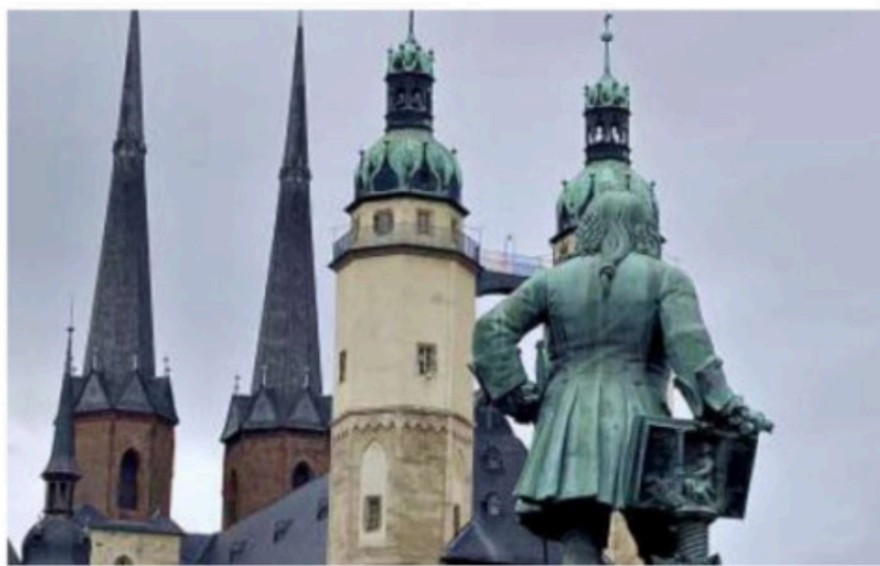
Georg Friedrich Händel schaut auf die Marktkirche, dem Rathaus hat er den Rücken zugekehrt.